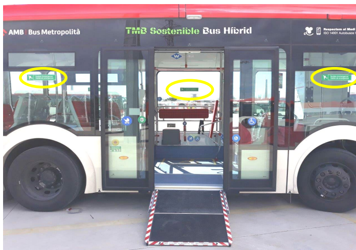
Imagen 1: Salidas emergencia

Estas estarán señalizadas para su fácil localización tanto del exterior como del interior del vehículo según imagen. Se colocarán en las mínimas ventanas necesarias para poder cumplir la normativa según CE 2001/85.